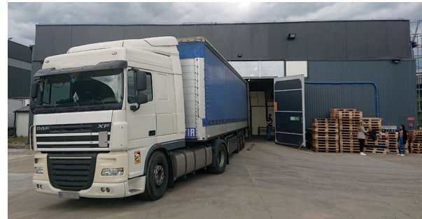
Abholung per LKW am NGO-Hub

Sobald dem Team German Food Bridge diese Informationen vorliegen, wird Ihre Spende bei den ukrainischen Partnern angemeldet und Sie erhalten die Information, welchem Hub in Polen Ihre Spende zugewiesen wird.