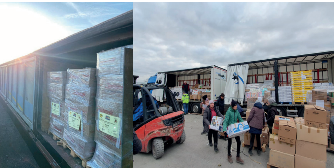
Verladung am Bahnhof in Polen

50 in der Ukraine aktive NGOs und offizielle staatliche Institutionen der humanitären Hilfe haben Zugriff auf die Spenden, welche über die German Food Bridge koordiniert werden. Ein besonderer Dank gilt der Handelskammer Hamburg für die schnelle und kostenfreie Zurverfügungstellung von Büroräumen und Büroaustattung für das Team der German Food Bridge. Außerdem danken wir der Deutsch-Ukrainischen Handelskammer (AHK) und Deutsch-Polnischen Industrie- und Handelskammer (AHK), sowie der DELTA Production and Trade Company für den Betrieb des Hubs in Dębica, Polen, als Umschlagplatz für Lebensmittel in die Ukraine.