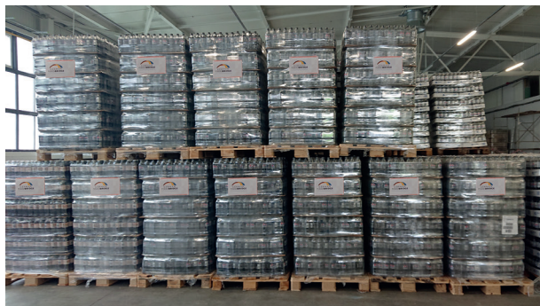
NGO-Hub – Lager vor dem Transport in die Ukraine